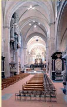
Innenraum der Liebfrauenkirche (F. Monheim) | Interior of the Church of our Lady (F. Monheim) | Intérieur de l'église Notre-Dame (F. Monheim)